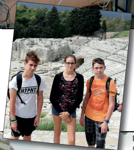
▼ Společné foto ze setkání – Catania / Sicílie