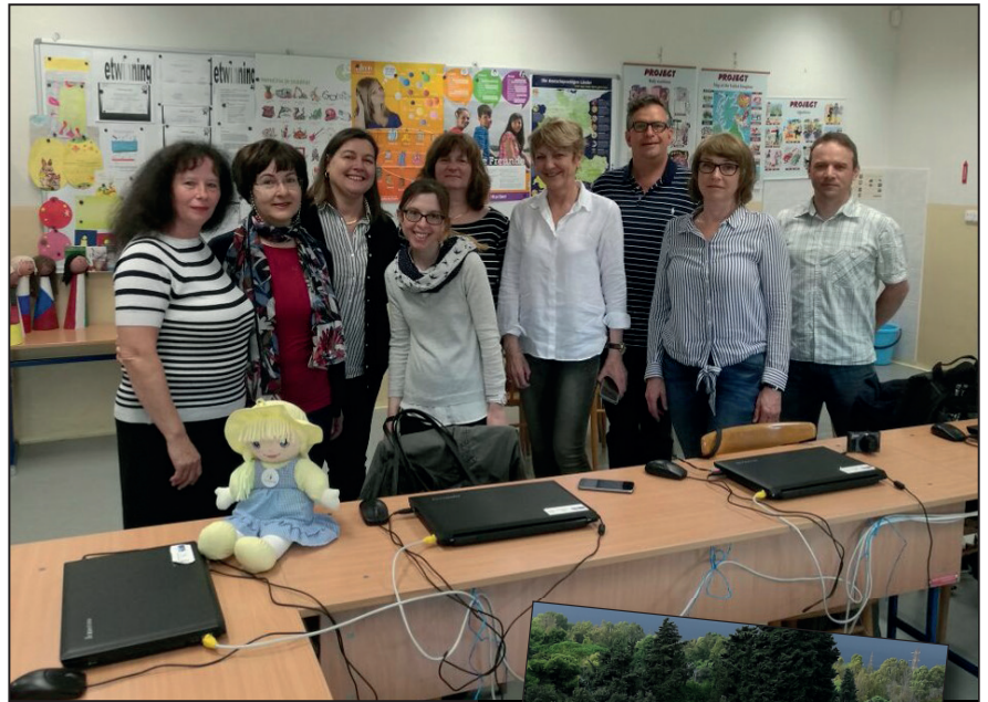
▲ 2. pracovní setkání v České republice ZŠ Bílá Lhota