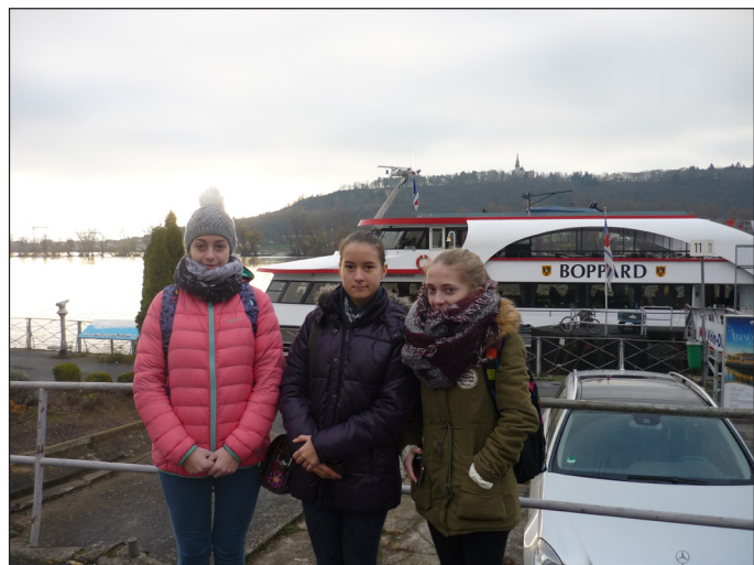
1. výjezd do Německa