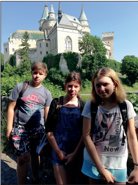
▶ 2. výjezd na Slovensko