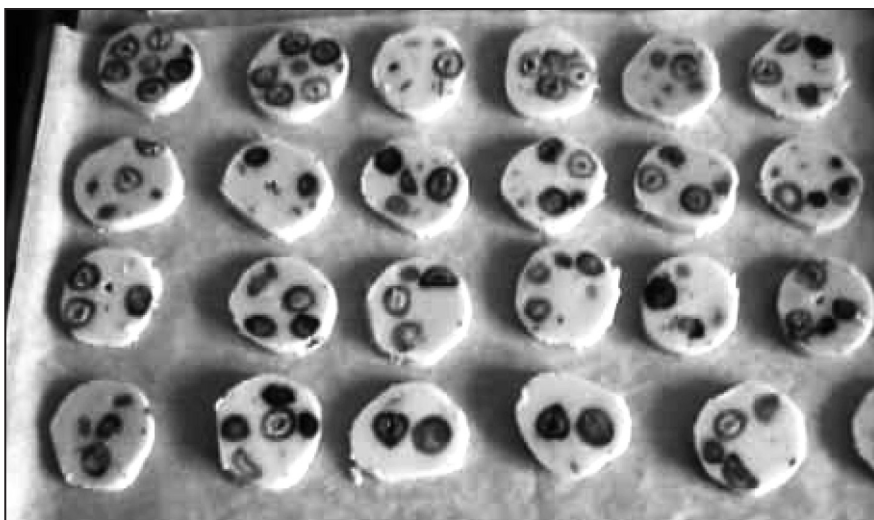
Masarykovo vánoční cukroví

Je to obrovská lahoda a hlavně to zvládne opravdu každý. Oříšky jsou zjemnělé a jdou krásně krájet, ovšem těsto musí být opravdu ztuhlé.