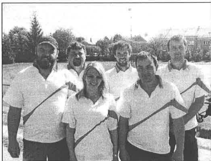
Místní slet v Litovli