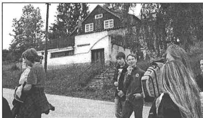
▲ Před chatou Pergamentkou