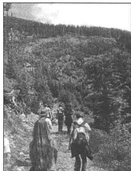
Kozí hřbety před námi