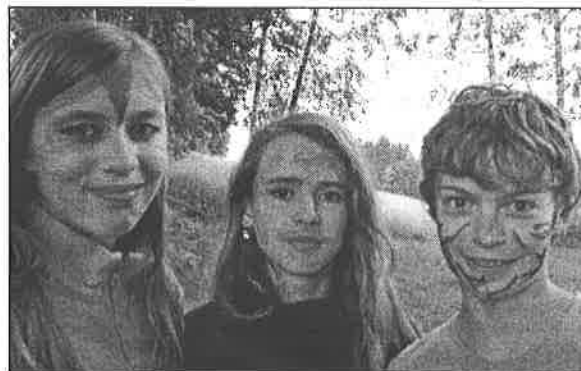
Na cestě za Robinsonem